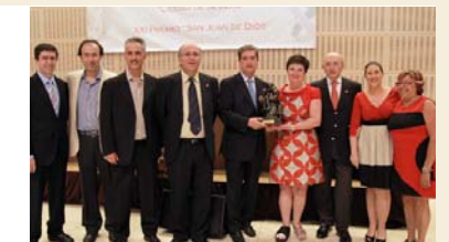
El Colegio sevillano entrega los premios de su Certamen y el San Juan de Dios