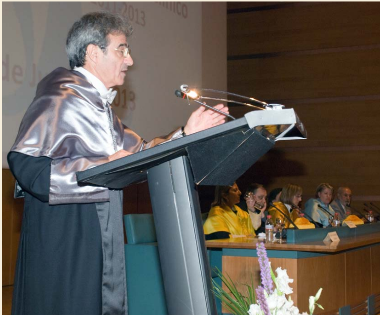
Intervención del presidente del Colegio de Enfermería de Cádiz durante la graduación