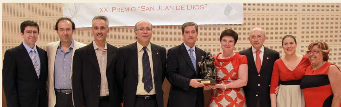
Todos los galardonados en el San Juan de Dios y el Certamen del Colegio de Sevilla