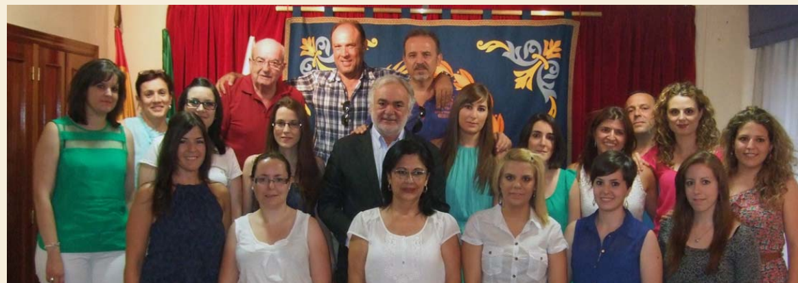
Alumnos del curso de Experto en el Área Quirúrgica y algunos miembros de la Junta de Gobierno

En este VIII Congreso Nacional de Enfermería en Ostomías se destacó, de forma especial, la importancia del perfil y cometido que desempeña la enfermera experta en ostomías. A este respecto, se apuntó cómo las personas que se ven forzadas a convivir con una ostomía sufren un primer y gran impacto físico-emocional capaz de alterar la vida cotidiana. En este contexto, el papel de la enfermera es clave, pues ofrece asesoramiento “de forma individualizada a cada paciente, preparándolo tanto para la operación quirúrgica como para los cuidados higiénicos-sanitarios que tendrá que asumir a posteriori de forma que, paulatinamente, se vayan incorporado hasta convertirse en una rutina para la vida diaria”.