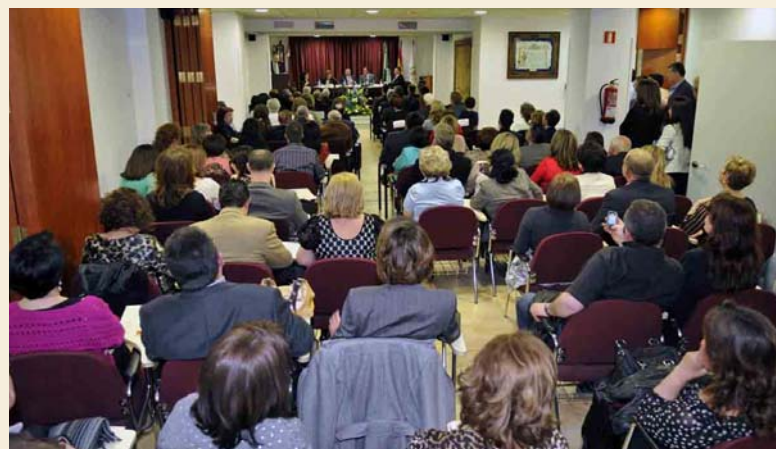
El Colegio, junto a las inquietudes profesionales. En la imagen, asistentes a la sede provincial

El Colegio Oficial de Enfermería de Almería está llevando a cabo una permanente labor de información respecto a la posibilidad de que las enfermeras y enfermeros sin perspectivas claras de tener, a corto y medio plazo, una ocupación en la sanidad almeriense, puedan encontrar algún proyecto viable en el extranjero.