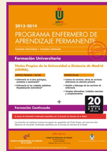
Cartel anunciador de los Expertos 2013/2014

Así, en el caso de los Expertos Universitarios semipresenciales, el Colegio de Enfermería de Córdoba oferta dos cursos: Enfermería en el área quirúrgica, anestesia y reanimación , además del de Enfermería en los cuidados paliativos. Hospitalización domiciliaria , ambas titulaciones propias de la UDIMA. Los dos combinan el seguimiento de las clases presenc-