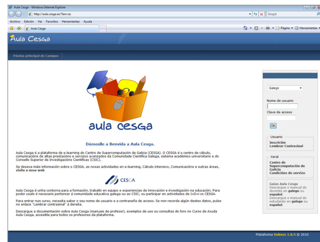
Plataforma de Teleformación

Los alumnos tendrán a su disposición todos los contenidos del curso "on line" a través de la Plataforma de Teleformación , desarrollada de manera conjunta con el Centro de Supercomputación (CESGA) de Galicia y que consta de varios apartados a los que se podrá acceder gracias a la contraseña facilitada a los alumnos.