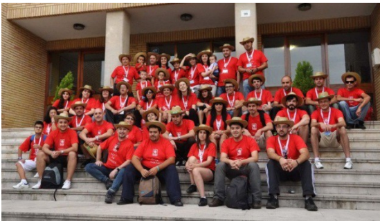
XIX Jornada de Jóvenes organizada por ACCU Cantabria

Se celebra esta Jornada coincidiendo con el Día Mundial de la Salud Digestiva que este año tiene como lema “La flora intestinal: su papel en la salud y en la enfermedad” que también será objeto de reflexión en esta Jornada.