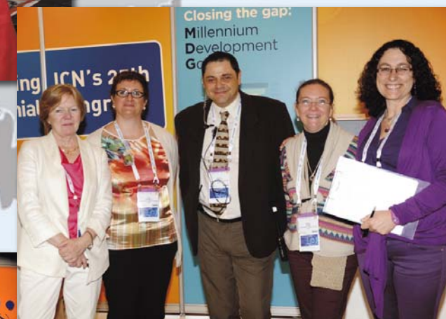
El congreso cuadrienal celebrado en Melbourne ha sido fruto del esfuerzo y dedicación del CIE y todo su personal, que se trasladó casi al completo hasta la ciudad australiana durante los días del evento