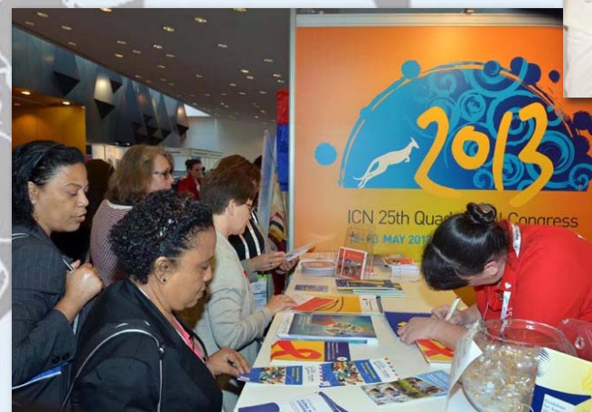
El propio recinto del congreso acogió también una exposición comercial en la que han estado representadas un total de 50 organizaciones de diversos países, incluyendo universidades, ministerios de sanidad, organizaciones de enfermería, editoriales y compañías farmacéuticas