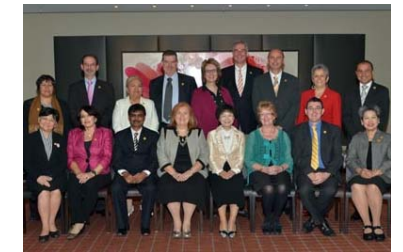
Durante el congreso de Australia se produjo el relevo en la presidencia y la junta directiva del CIE